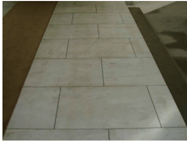
表面が劣化して変色しています

さて、今回は昔に行ったものですが「大理石の剥離」です。しかも天然もの。難易度はかなり高いです。へたすると黄色く変色してしまいますから。と言いますか普通大理石の剥離はやらないものなのですが。