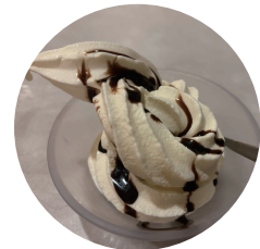
チョコをかけた ソフトクリーム