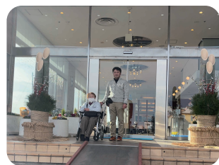
年末なので門松が 飾ってありました