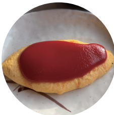
ケチャップを かけすぎた オムレツ