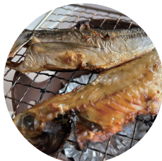
こげる寸前の アジ