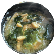
具を入れすぎた みそ汁