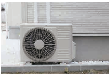
家庭用エアコンの 室外機