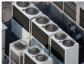
よくビルの屋上にある 業務用エアコンの室外機

室内機はすぐにいつも見えますが 室外機は家の外で裏にあったりして あまり見ないことが多いのではない でしょうか？ 戸建ての家ですと土の上にあたり してしらないうちにつる草が絡んで いたりすることもあります。